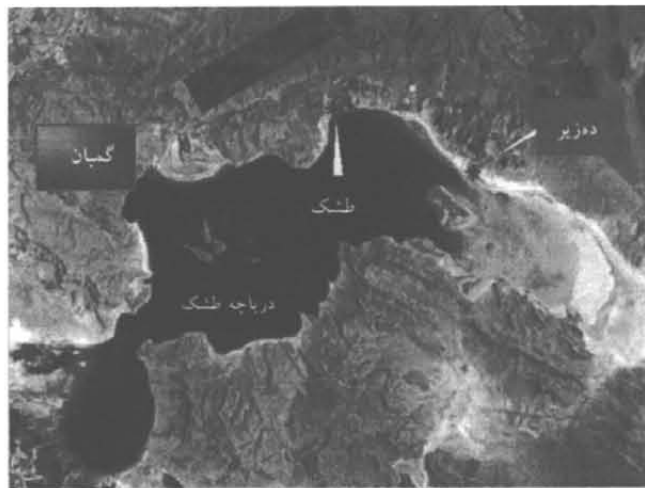
شکل ۱: تصویر ماهواره‌ای محدوده مطالعاتی و موقعیت جغرافیایی ایستگاههای نمونه برداری

برای انجام این آزمایش محیط کشت مایع ONR7a با غلظت‌های مختلف نمک NaCl (۰.۲، ۰.۴، ۰.۶، ۰.۸، ۱.۰، ۱.۲، ۱.۴، ۱.۶، ۱.۸، ۲.۰ درصد) به میزان ۱۰۰ میلی لیتر در ارلن‌هایی با حجم ۵۰۰ میلی لیتر تهیه شد (از هر کدام دو تا، یکی برای نفتالین و یکی برای آنتراسین). سپس به هر ارلن PAH مربوط به آن (نفتالین یا آنتراسین)، به میزان یک میلی‌گرم در میلی لیتر اضافه گردید. به هر ارلن سوسپانسیون باکتریایی تهیه شده در مرحله قبل اضافه شد. از دو ارلن حاوی محیط کشت و PAH (یکی با نفتالین و یکی با آنتراسین) و بدون تلقیح توسط سوسپانسیون باکتریایی نیز بعنوان شاهد استفاده گردید. سپس تمامی ارلن‌ها در دمای ۲۵ درجه سانتیگراد و ۹۰ دور در دقیقه گرمخانه‌گذاری شدند (Kasai & Kishira, 2002).