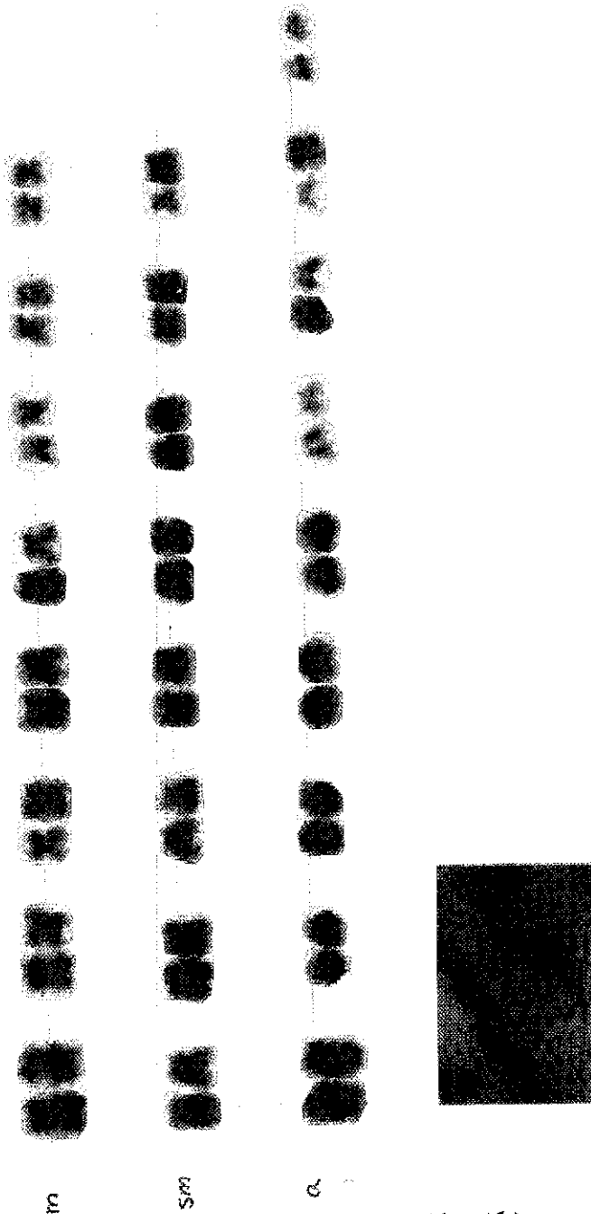
شکل ۲: کاریوتایپ ماهی سیم ( Abramis brama )