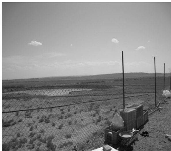
شکل ۲-۱. منطقه پرورش ماهی قزل آلا در آب لب شور استان خراسان شمالی