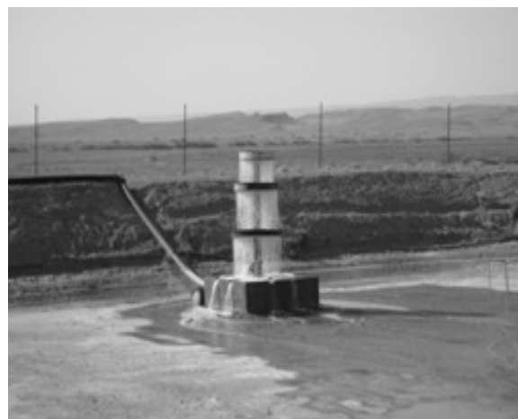
شکل ۲-۲ و ۳-۲. استخرهای پرورش ماهی قزل آلا قبل از آبیگری (چپ) و در حال آبیگری (راست)