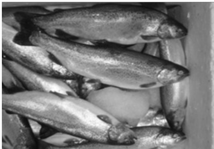
شکل ۳-۳. ماهیان پرورشی قزل آلا ی رنگین کمان در آب لب شور پس از برداشت نهایی