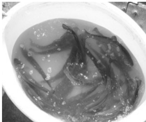
شکل ۳-۱ و ۳-۲. ماهیان قزل آلا صید شده جهت زیست سنجی (راست) و ماهی قزل آلا آماده زیست سنجی (چپ)