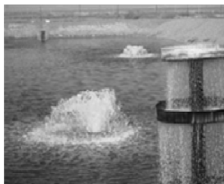
شکل ۲-۶ و ۲-۷. استخر پرورش در حال هوادهی (راست) و تجمع ماهیان پرورشی در استخر (چپ)