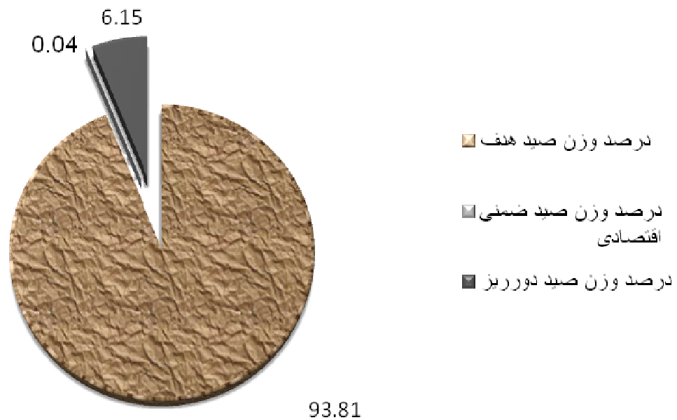
شکل ۴- درصد وزن کل صید هدف، ضمنی اقتصادی و دورریز گرگور در سواحل استان خوزستان

میانگین وزن کل صید بدست آمده در هر گرگور در این پروژه 1/06 \pm 1/66 کیلوگرم بر شبانه‌روز بر گرگور بود که 93/81 درصد از وزن کل صید شامل آبزیان هدف (کفزی صخره‌ای) و 6/19 درصد آبزیان ضمنی (غیر کفزی و دورریز) و 6/15 درصد آبزیان دورریز بود. میانگین وزن کل صید هدف در هر گرگور 1/09 \pm 1/58 کیلوگرم و میانگین وزن کل صید ضمنی در هر گرگور در طول این دوره 0/078 \pm 0/11 کیلوگرم و میانگین وزن کل صید دورریز 0/078 \pm 0/11 کیلوگرم بود (شکل ۴).