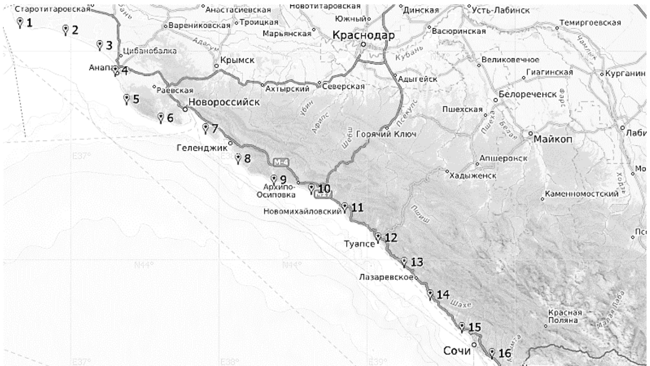
Рис. 1. Район отбора проб рапаны в северо-восточной части Черного моря в 2011–2015 гг.