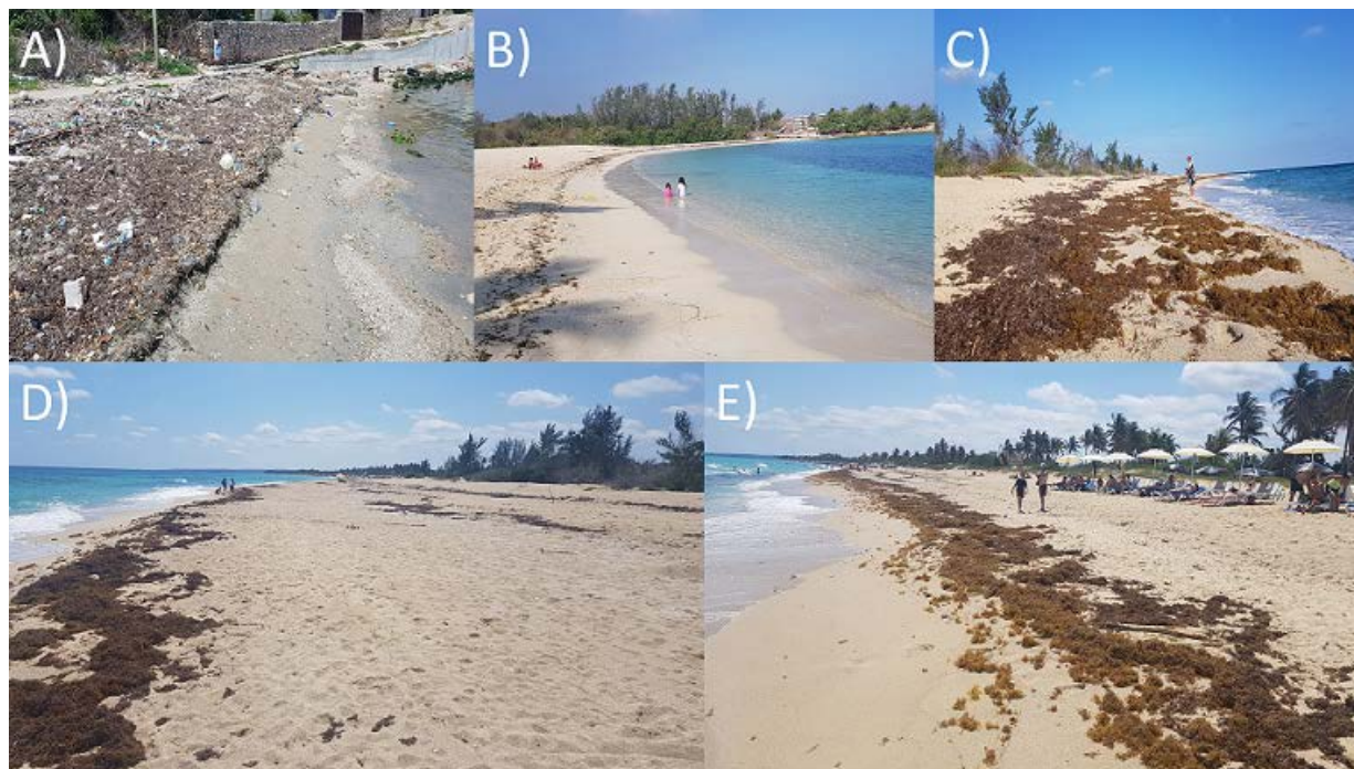
Fig. 3. Fotografías de las arribazones en las cinco playas muestreadas A) Cojímar, B) Bacuranao, C) Tarará, D) Mégano, E) Santa María.

12 Ochrophyta, 11 Rhodophyta y dos Tracheophyta), 64 especies para Tarará (23 Chlorophyta, 16 Ochrophyta, 22 Rhodophyta y tres Tracheophyta), 73 especies para Mégano (30 Chlorophyta, 20 Ochrophyta, 19 Rhodophyta y cuatro Tracheophyta) y 65 especies para Santa María (31 Chlorophyta, 14 Ochrophyta, 16 Rhodophyta y cuatro Tracheophyta). Las más comunes y abundantes en las arribazones fueron las especies de sargazo de vida pelágica, específicamente S. fluitans y S. natans (Fig. 3). Además, se reportaron comunes en las cinco playas las especies de macroalgas verdes Cladophoropsis membranacea (Hofman Bang ex C. Agardh) Børgesen, Halimeda discoidea Decaisne y Ulva lactuca Linnaeus; las pardas Dictyota ciliolata Sonder ex Kützinger, Lobophora cf. variegata , Styopodium zonale (J. V. Lamouroux) Papenfuss y Taonia abbottiana D. S. Littler & Littler; las rojas Digenea