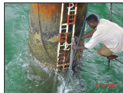
Sécurisation du PVC/Capteur