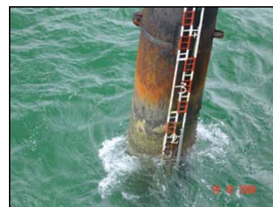
Matériel installé, premier enregistrement à 10 heures (19/10/2006)