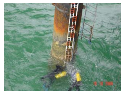
Installation du PVC contenant le capteur contre l'échelle de marée par deux plongeurs