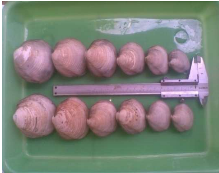
Gambar 1. Spesies Anodonta edentula Linnaeus, 1758 di Kabupaten Muna.

Secara umum, di Indonesia kerang lumpur kurang mendapat perhatian, hal ini tidak berbeda dengan di Kabupaten Muna oleh instansi terkait, kerang ini belum diidentifikasi sebagai salah satu komoditi perikanan. Selain itu, informasi tentang spesies ini masih sangat sedikit (Taylor, et al., 2000) (Taylor, et al., 2006). Padahal spesies ini mempunyai nilai ekonomis, ekologis dan nilai gizi yang cukup tinggi, tetapi penelitian-penelitian tentangnya masih sangat kurang (Rochmady, et al., 2012). Masyarakat lokal menyebutnya ghiwo dan ditemukan melimpah di perairan estuaria Pulau Toba dan Pesisir Lambiku, Kecamatan Napabalano (Rochmady, 2011). Dimanfaatkan sebagai sumber protein hewani (Sjafaraenan, 2011) dengan kandungan gizi yang memiliki komposisi kadar air 80%, protein 10,8%, lemak 1,6%, abu 0,75% dan karbohidrat 0,6% (Natan, 2008). Kandungan gizi kerang lumpur di daerah Kabupaten Muna dengan komposisi protein 7,182%, karbohidrat 66,887%, lemak 6,820%, kolesterol 10,00 mg/dl, HDL, 6,00 mg/dl, Ca 263,385 ppm, Cu 9,107 ppm, Mg 28,467 ppm, Fe 1,859 ppm, dan LDL serta Zn konsentrasi tidak terdeteksi (Sjafaraenan, 2011).