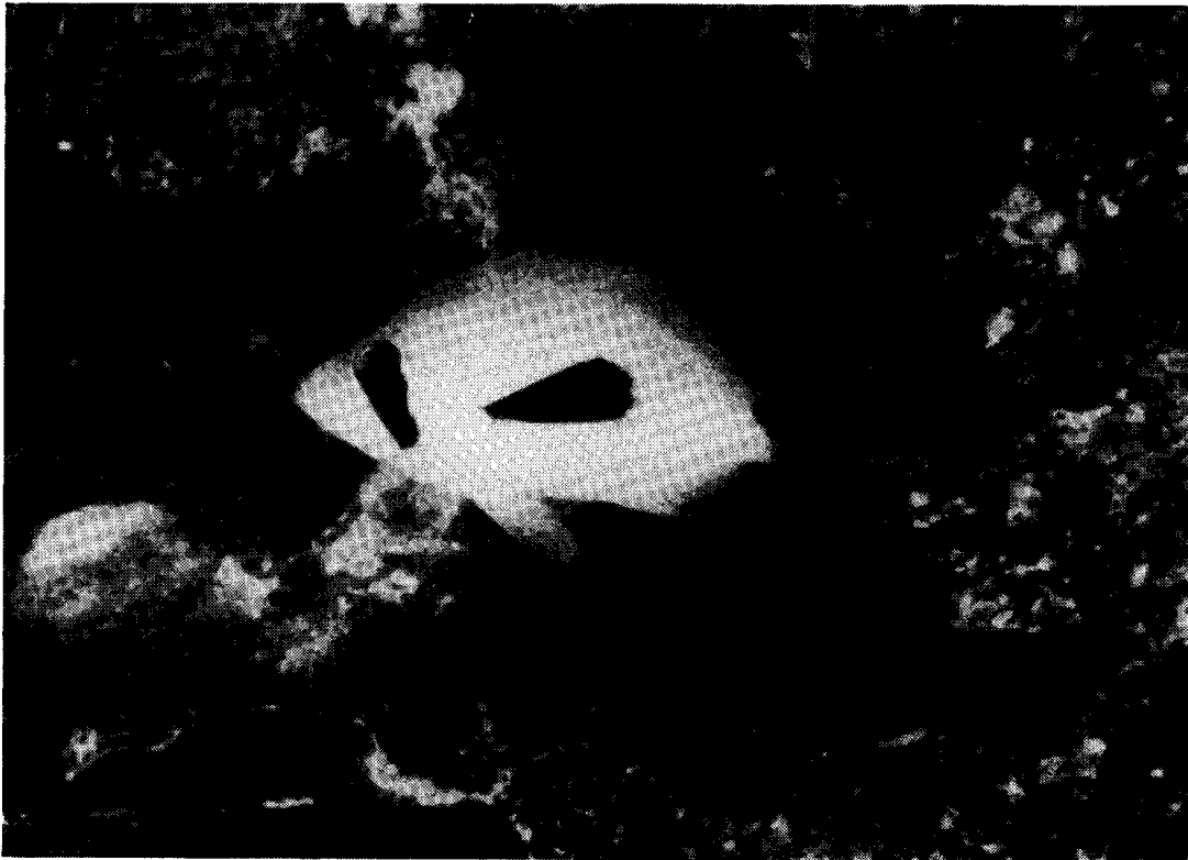
Figura 1. Hypoplectrus providencianus spec. nov. en su ambiente en Cayo Bolívar (Colombia), 10 m de profundidad, mayo 25/1994.

común “blacktail hamlet”); Humann (1989): 92-93 (coloración, distribución, comentarios sobre biología, nombre común “masked hamlet”).