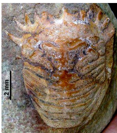
Figura 1. La especie Lophoranina precocious es el decápodo fósil más antiguo registrado en Cuba (Varela y Rojas-Consuegra, 2009).

El ejemplar procedente de la Fm. Cotorro, de la cercanía a de Sierra de Potrerillo (Cruces, Cienfuegos), posee una excelente conservación. Presenta una coloración amarillo ambarino, posiblemente muy semejante a la original. Se trata de una pieza constituida por un caparazón embebido en una arenisca vulcanomíctica a polimíctica, de grano medio, de color grisáceo, compacta.