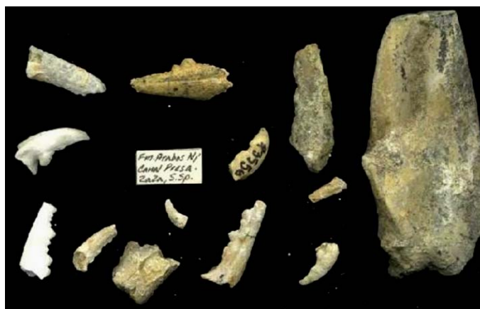
Figura 4 En el importante yacimiento de vertebrados fósiles neogénicos “Domo Zaza” también se ha recuperado un material diverso de decápodos fósiles.

La asociación fósil registrada incluye entidades conservadas de vertebrados terrestres, de ambiente costero y marinos; así como una abundante asociación fósil de distintos invertebrados marinos.