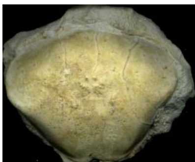
Figura 3 La Fm. Colón es la unidad litoestratigráfica que mayor cantidad de ejemplares y diversidad taxonómica de decápodos ha dado en Cuba.

El material fósil proveniente de la Fm. Colón, desde el punto de vista taxonómico, el material presenta una coloración predominante, que va del blanco grisáceo a amarillento, hasta blanco claro (Fig. 3). La mayoría de las piezas están constituidas por moldes internos o externos, y en menor grado, por los restos de la sustancia calcárea biogénica original, aunque con visibles estados de disolución, o en general, de transformación textural o composicional. No obstante, en algunas piezas se observan estructuras con valor taxonómico, en excelente estado de conservación, por lo que se puede realizar una identificación segura del material.