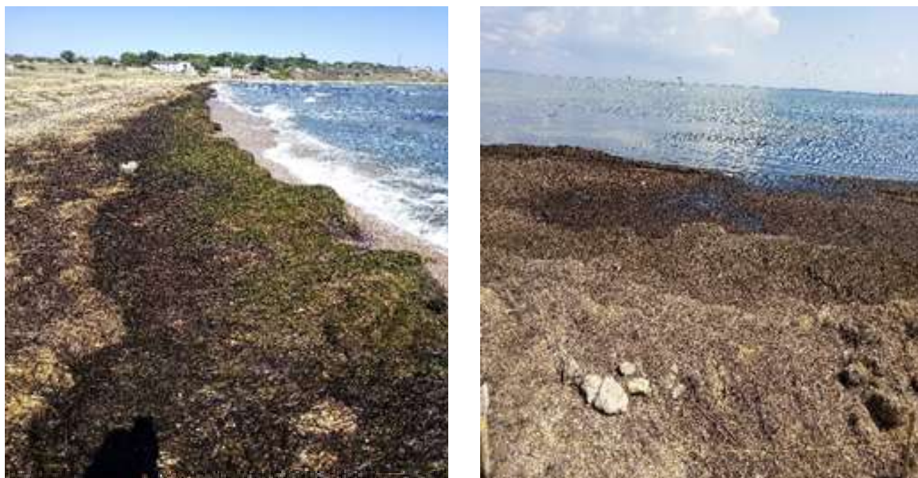
Рис. 1. Штормовые выбросы zostеры