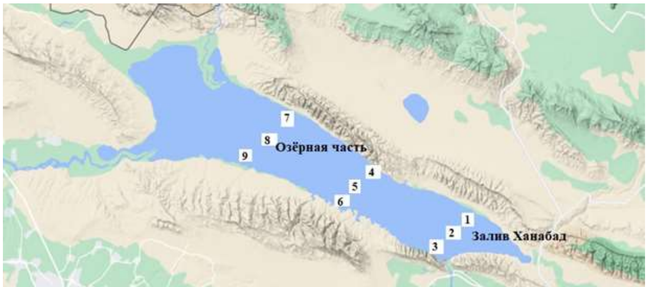
Рис. 1. Карта-схема расположения станций отбора проб в Мингечевирском водохранилище

собрано 138 проб, из них 90 — количественные и 48 — качественные (рис. 1). Для сбора материалов из пелагиали использовалась сеть Апштейна (№ 77). Для сбора качественных образцов из различных участков водохранилища (камни, песок, черный ил) применяли сита различных размеров. Собранные материалы были зафиксированы в 4%-ном растворе формалина и этикетированы. Для просмотра проб в лабораторных условиях использовались бинокулярные микроскопы (Olympus CX 41 RF и Nikon 1270), при идентификации видов применялся определитель [6]. Биомасса видов была определена в соответствии с методиками Руттнер-Колиско, 1977 и Балускиной, Винберга, 1979 [7, 8]. Для определения роли отдельных видов в формировании комплекса зоопланктона была рассчитана частота встречаемости (pF) [9, 10]. Температура воды на каждой станции измерялась термометром.