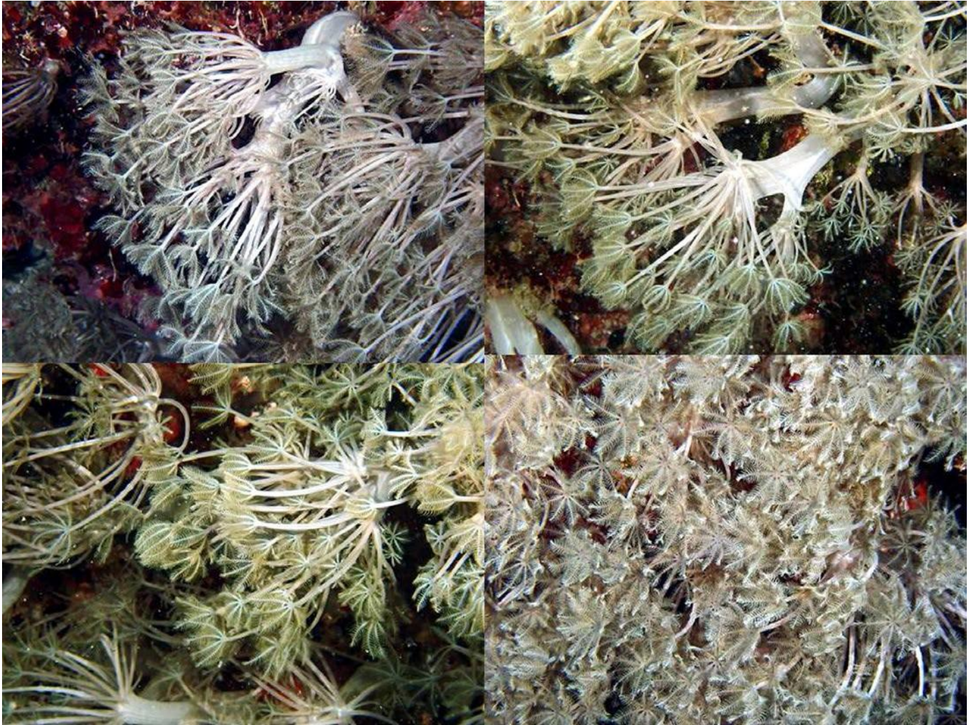
Fig. 3. Imágenes de Unomia stolonifera tomadas por nuestro equipo de trabajo, 13 se marzo de 2023.

Con autorización de la Oficina de Regulación y Seguridad Ambiental (ORSA), de fecha 24 de marzo 2023, el 27 de marzo de este año se realizó la extracción de todos los ejemplares y su posterior destrucción, cuidando que no se esparcieran en el medio ni fuera del agua ejemplares ni fragmentos de ellos (Fig. 5).