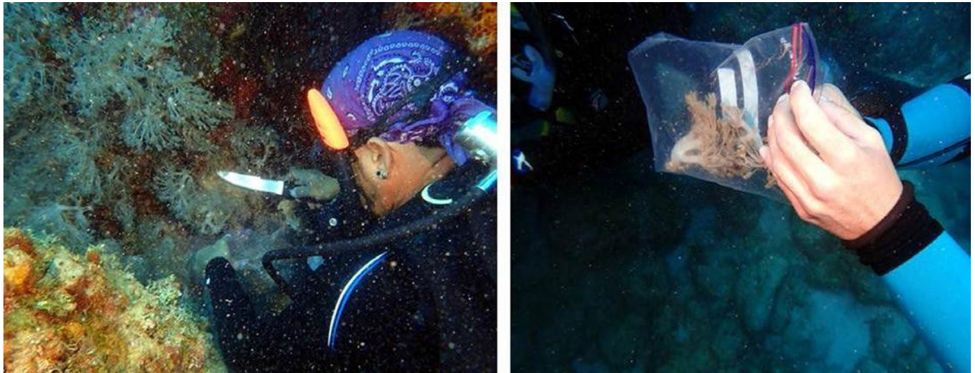
Fig. 4. Toma de muestras de Unomia stolonifera , 13 de marzo de 2023.

completamente erradicado. Por el peligro que representa esta especie invasora para la salud y conservación de la biodiversidad de nuestros arrecifes coralinos, queremos compartir con la comunidad científica cubana, caribeña e internacional su hallazgo y las acciones realizadas para su erradicación.