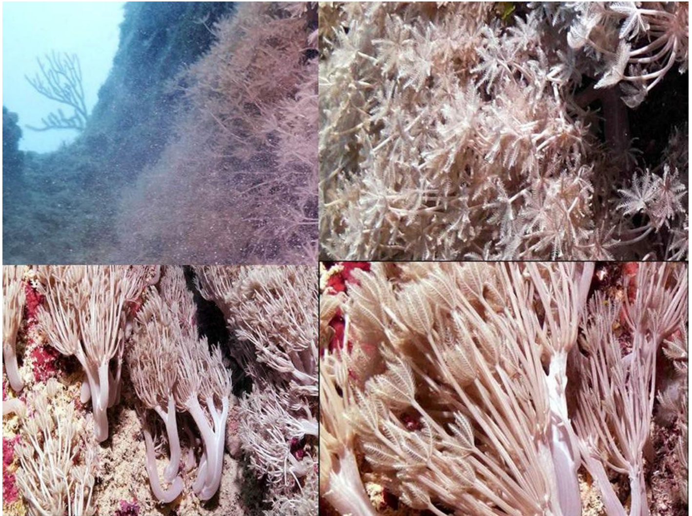
Fig. 1. Imágenes de Unomia stolonifera tomadas por el equipo de Naturaleza Secreta en septiembre de 2022.

especie, pues surgió la sospecha de que podía tratarse de Unomia stolonifera (Gohar, 1938) especie marina invasora, original del Océano Indo-Pacífico reportada por primera vez para el Caribe en las costas de Venezuela en el año 2014 (Ruiz-Allais et al. , 2014, 2021).