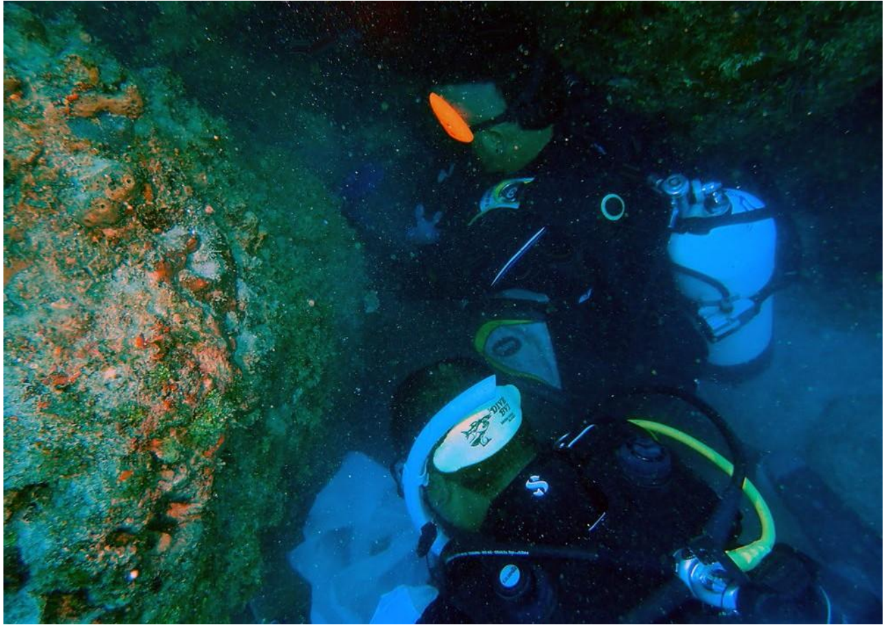
Fig. 5. Extracción total de de Unomia stolonifera en la Ensenada de Bacuranao, 27 de marzo de 2023.