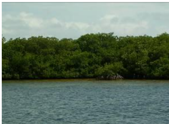
Figura 4. Manglares. Figure 4. Mangrove forests.