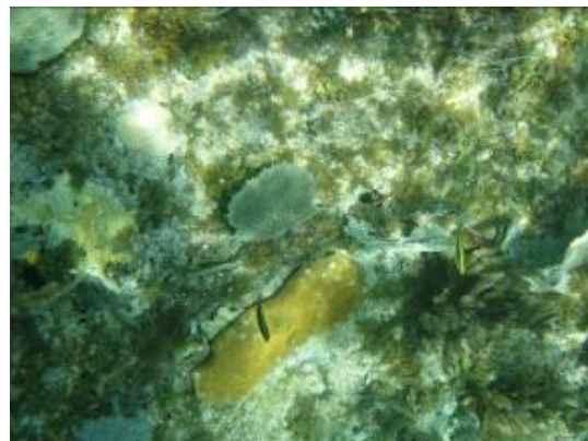
Figura 3. Arrecifes coralinos. Figure 3. Coral reefs.