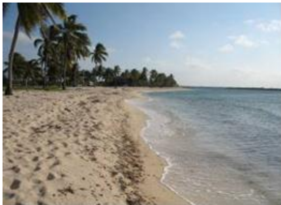
Figura 2. Playas. Figure 2. Beachs.