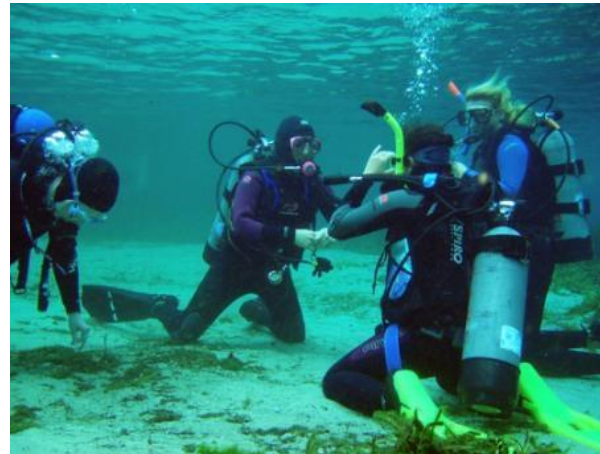
Figura 9. Buceo contemplativo. Figure 9. Contemplative diving.