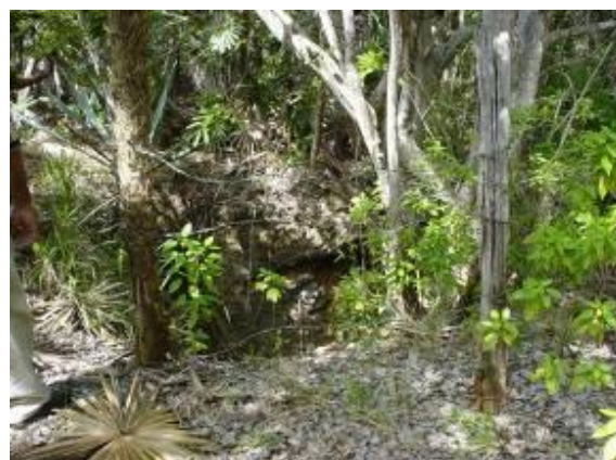
Figura 5. Bosques. Figure 5. Forests.

Aun cuando existen varios estudios referidos a los aspectos físicos, geográficos, ecológicos, sociales y económicos sobre la zona costera norte de la provincia de Camagüey, así como múltiples informaciones referidas al impacto del cambio climático en su sistema productivo, se precisa en este ecosistema, de nuevas informaciones y análisis para perfeccionar la adaptación al cambio climático, a partir de la relación existente entre la empresa, el medio ambiente y la comunidad con aplicación de acertadas medidas y acciones de manejo integrado.