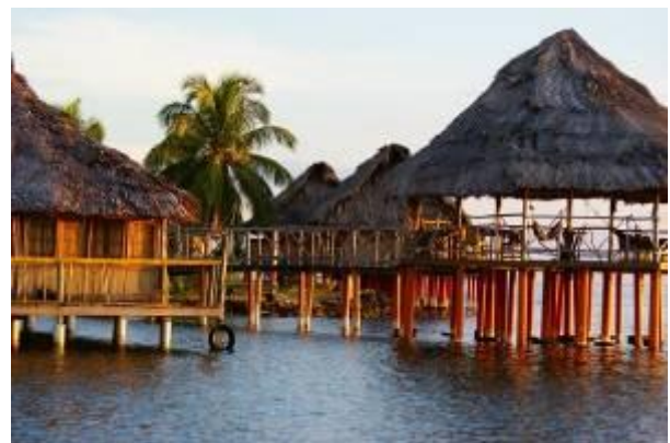
Figura 7. San Blas, Panamá. Figure 7. San Blas tourist resort, Panama.