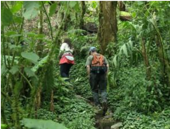
Figura 8. Excursiones terrestres (senderismo). Figure 8. Land tours (trekking).