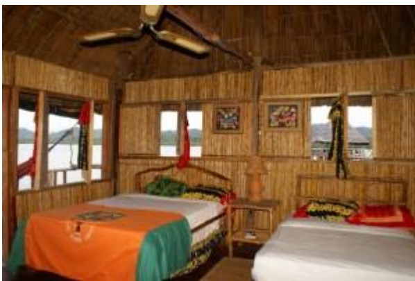
Figura 6. Los Quetzales, Panamá. Figure 6. Los Quetzales tourist resort, Panama.