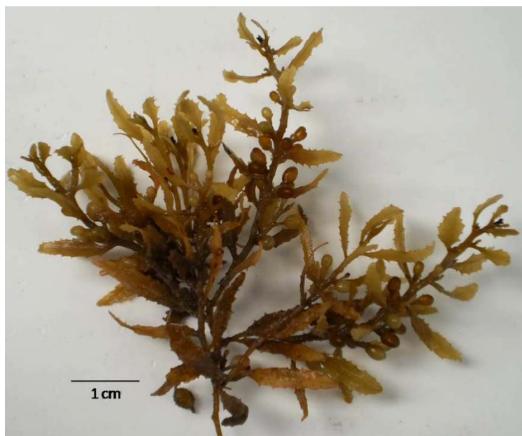
Figura 2. Rama de Sargassum fluitans

Las mayores afectaciones ocurrieron en el sector turístico, causando alarma en los bañistas, en los medios de prensa y el cierre temporal de las actividades recreativas en la playa Rancho Luna, litoral oriental de Cienfuegos. El Delfinario de Cienfuegos, ubicado en una pequeña ensenada aledaña a esta playa, fue obstruido completamente por la arribazón de Sargassum y los delfines tuvieron que ser retirados de la ensenada (Figura 3). Los conglomerados de Sargassum formados en la orilla de la playa Rancho Luna alcanzaron varios metros de altura. En general, la población y trabajadores de esa zona costera de Cienfuegos no habían observado una arribazón de macroalgas de esa magnitud.