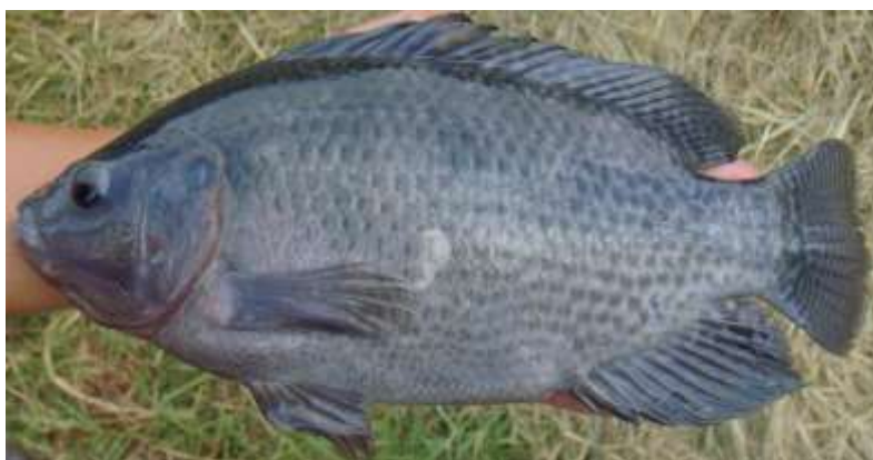
Figura 1: Tilápia do Nilo ( Oreochromis niloticus ) da variedade GIFT

OLIVEIRA et al., (2011) analisando a variabilidade genética de três gerações da linhagem encontrou alta variabilidade intrapopulacional, indicando que o Programa de Melhoramento genético está sendo conduzido de modo correto.